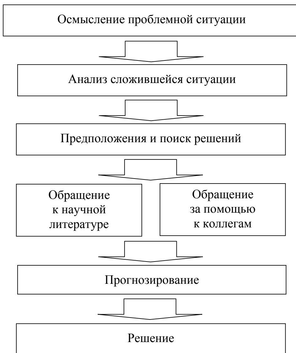
Рис. 4. Алгоритм решения ситуационной задачи

На основе анализа научной литературы можно выделить следующий алгоритм решения ситуационной задачи (рис. 4).