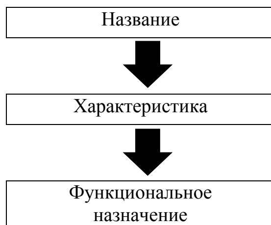
Рис. 2. Схема представления моделей наставничества

Модели наставничества будут представлены по следующей схеме: