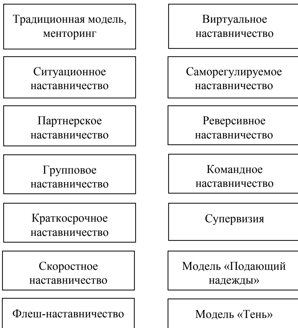
Рис. 1. Модели наставничества

Модели наставничества будут представлены по следующей схеме: